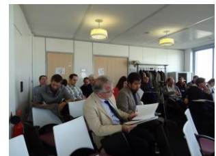
Salle de séminaire dans les locaux du CNRS