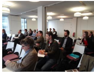
Salle de séminaire dans les locaux du CNRS