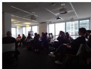
Salle de séminaire dans les locaux du CNRS