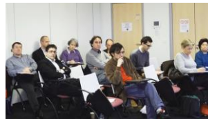
Salle de séminaire dans les locaux du CNRS