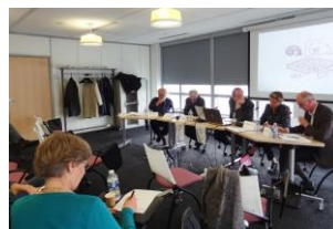
Salle de séminaire dans les locaux du CNRS