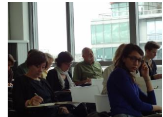
Salle de séminaire dans les locaux du CNRS