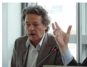
Christian de Portzamparc