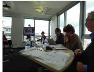
Salle de séminaire dans les locaux du CNRS