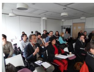
Salle de séminaire dans les locaux du CNRS