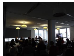
Salle de séminaire dans les locaux du CNRS